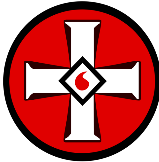
Рисунок 1. Эмблема ультраправой организации «Ку-клукс-клан»