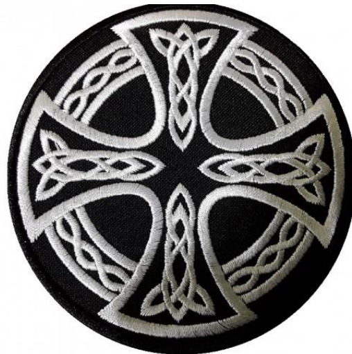
Рисунок 2. Кельтский крест. Символ многих расистских организаций